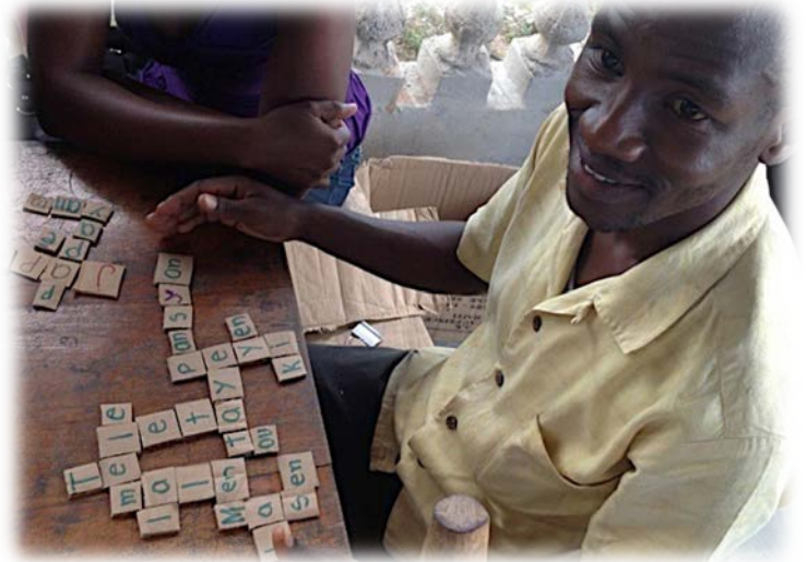
Pwofèsè a pran istwa elèv li yo epi li ekri istwa yo sou tablo a Pwofèsè a kreye materyèl pou jwèt sou alfabè a