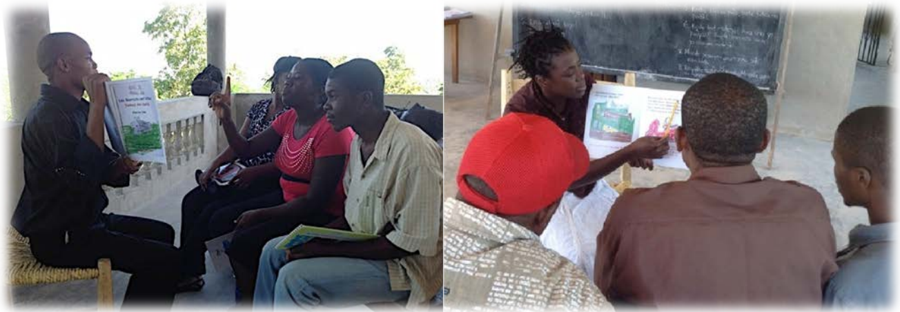
Pwofesè yo ap pratike teknik la.

Lekti entèraktif a wot vwa se yon pwosesis kote pwofesè li yon bon tèks pou klas li. Li prepare ann avans ki lè l ap poze kesyon nan mitan istwa a pou l ankouraje ti moun yo reflechi epi diskite istwa a ansanm. Yon anbyans kote ti moun yo chita alèz nan wonn oswa an gwoup devan pwofesè a, sa enpòtan anpil. Pwofesè a dwe itilize teknik sa a pou l li liv lang manman yo ansanm ak nenpòt lòt tèks elèv yo gen pou yo li. Pwofesè a dwe gen 20 minit chak jou nan orè klas la pou l li pou elèv yo a wot vwa. Souvan, pwofesè yo konn fè aktivite sa a apre rekreyasyon fèk fini pou ede klas la rekonsantre sou devwa yo.