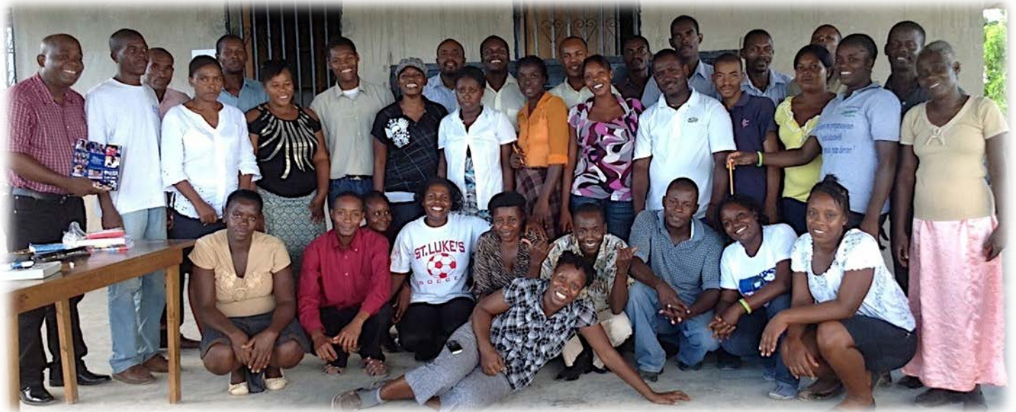
Ekip Liv Lang Manman, Lagonav, Ayiti

Nou vle remesye tout moun sa yo ki kontribye nan reyalizasyon 50 LLM yo ansanm ak gid pou pwofesè sa a :